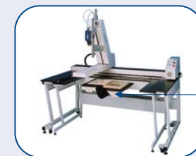
Opción Porta-libros 20cm/25kg